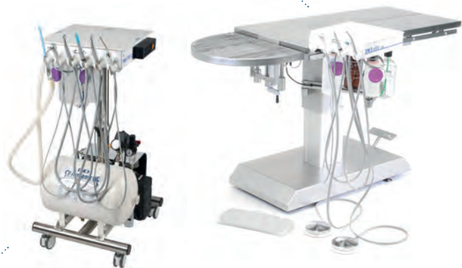
iM3 Pro 2000