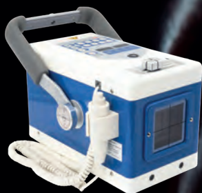
VISIOVET 9020 BT

Geben Sie sich nur mit dem Allerbesten zufrieden! Bestehen Sie neben exzellenter Bildqualität auch auf unübertrefflich lange Lebensdauer bei der Auswahl Ihres Systems.